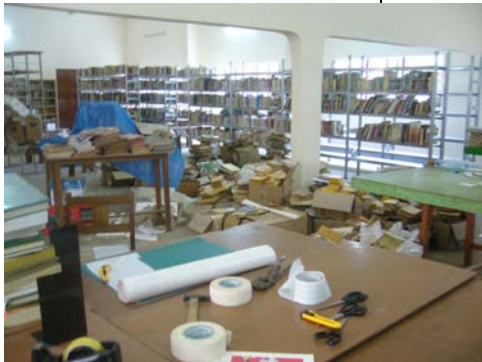
L'atelier de couverture des livres