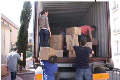
Chargement à Montrouge