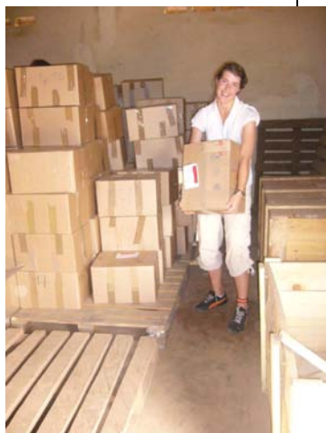
Chargement à Dapaong