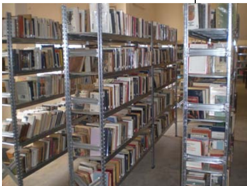
Les nouveaux rayonnages bien garnis

notamment de BNP Paribas et de la Région Ile de France pour les plus importantes ; enfin, se sont ajoutées les revenus d'actions ponctuelles régulières, comme les ventes de gâteaux, la tenue de vestiaires ou des journées d'ensachages dans des grandes surfaces.