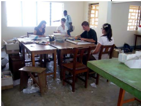
L'équipe au travail