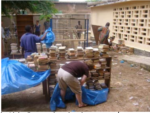
Le tri des livres anciens dans la cours