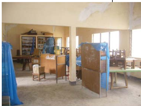
La bibliothèque à l'arrivée

Tout élève de Stanislas connaît, au moins de nom, l'ADESDIDA, ne serait-ce que grâce aux opérations « bol de riz » réalisées chaque année et dont le produit est pour partie accordé à cette œuvre humanitaire. L'ADESDIDA, Association pour le Développement Economique et Social du Diocèse de Dapaong, est une association qui agit au nord du Togo, dans la région des Savanes dont la ville principale est Dapaong. Elle entreprend de nombreuses actions pour les familles, comme la tenue d'un centre de formation rural, le soutien à un dispensaire, l'aide à la construction de barrages et de puits ou d'autres projets ponctuels.